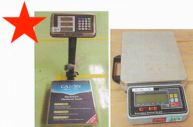
Figure 1 : CAMRY Foldable Platform Scale and GMS Portable Postal Scale