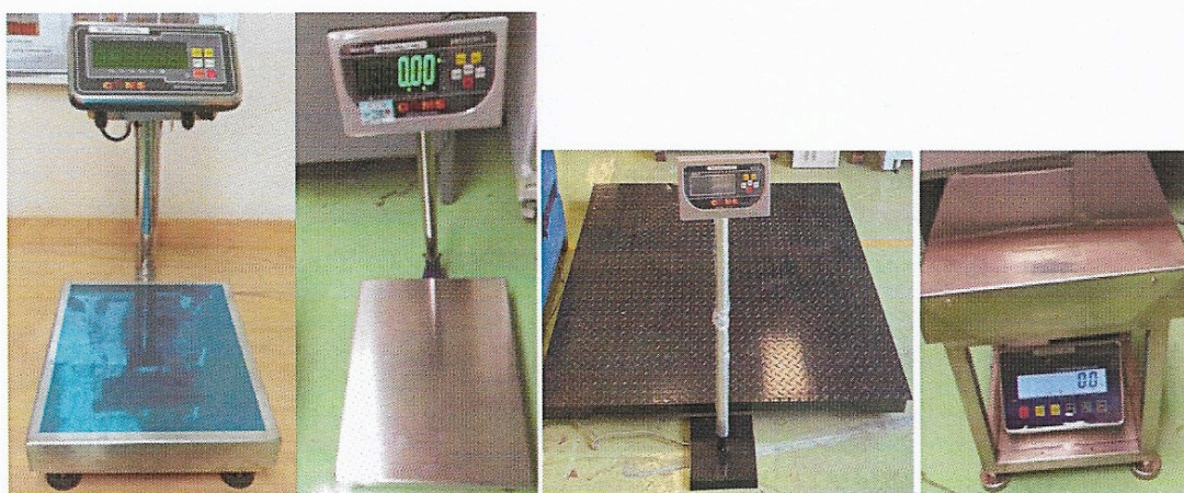
Figure 2: GMS Platform Scale, GMS Bench Scale and GMS Floor Scale