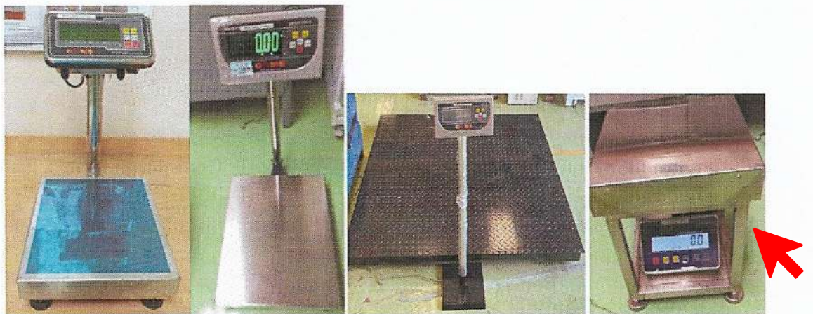
Figure 2: GMS Platform Scale, GMS Bench Scale and GMS Floor Scale